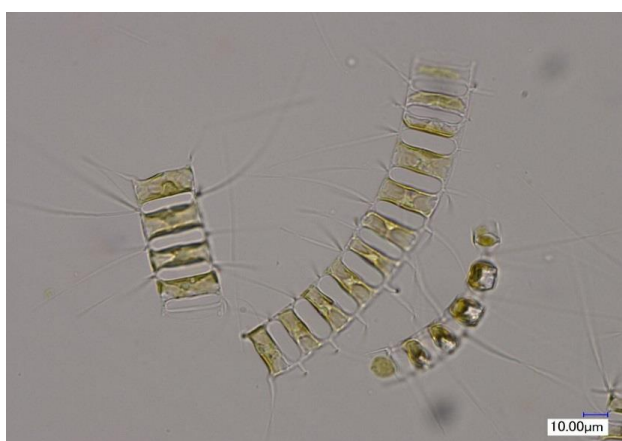
培養細胞（光顕：培養Well-plate）