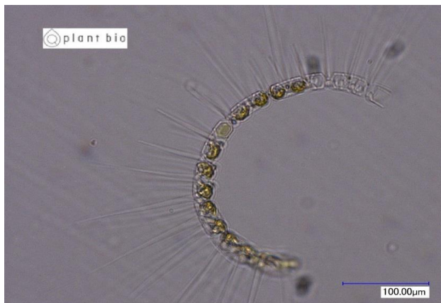
生細胞（光学顕微鏡）