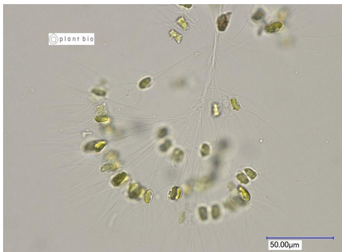
生細胞 (光学顕微鏡)