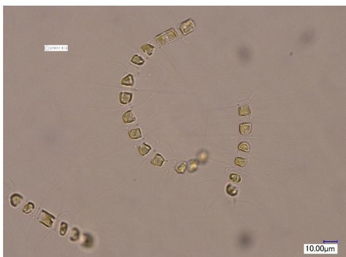
培養細胞 (光顕 : 培養Well-plate)