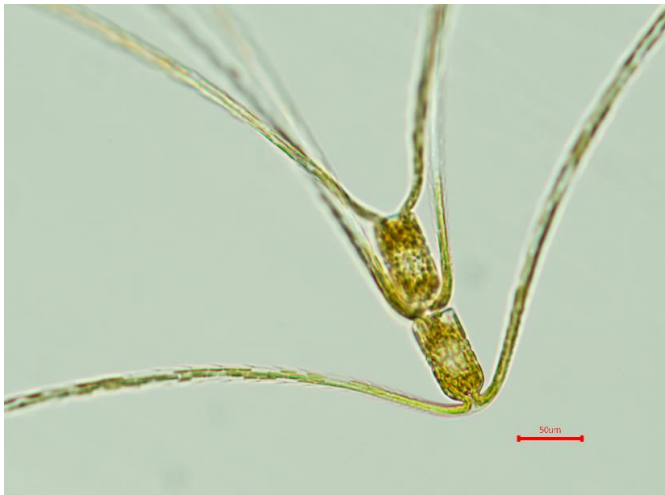
生細胞 (光学顕微鏡)