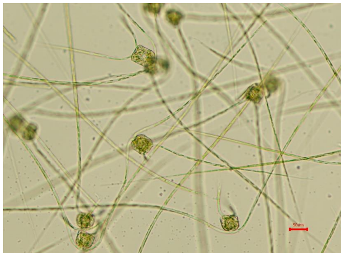
培養細胞 (光顕:培養Well-plate)