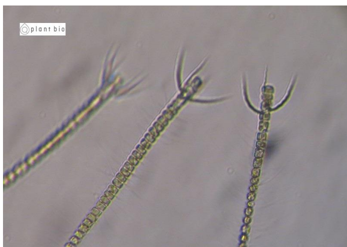
培養細胞（光顕：培養Well-plate）