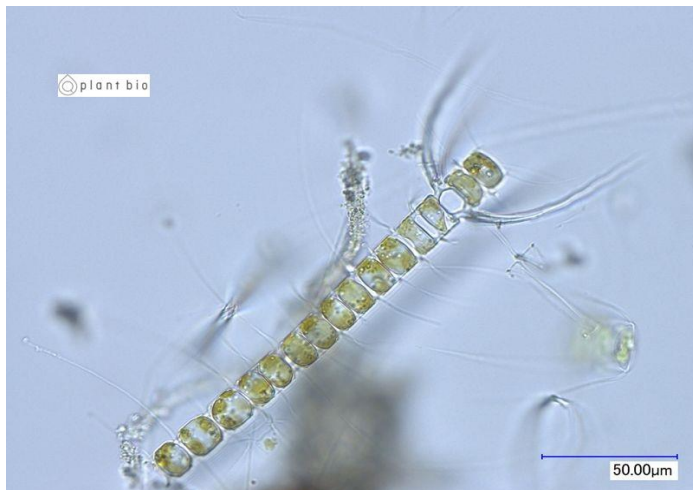
生細胞（光学顕微鏡）