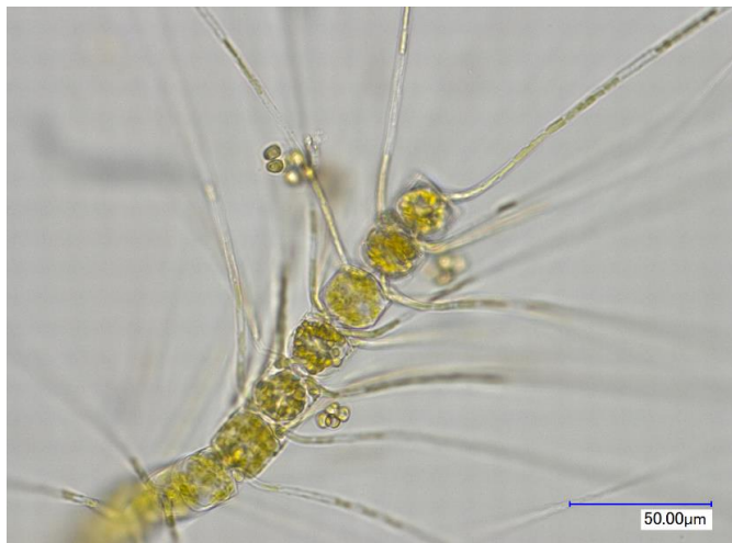
生細胞 (光学顕微鏡)