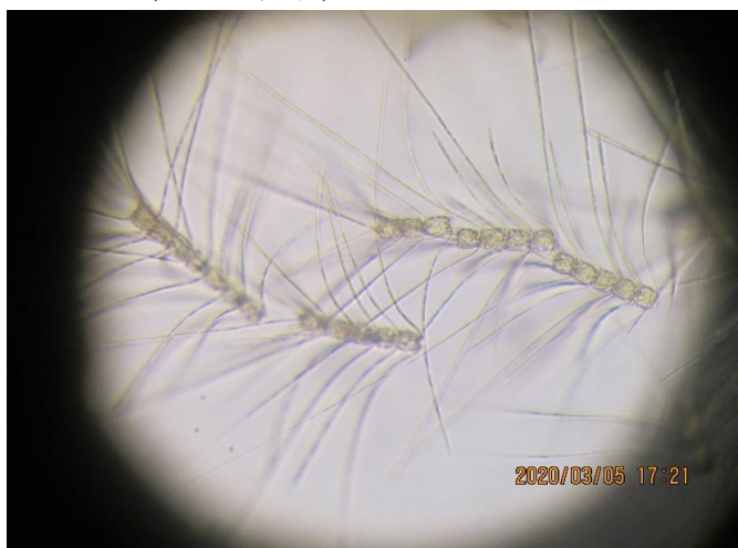
培養細胞 (光顕: 培養Well-plate)