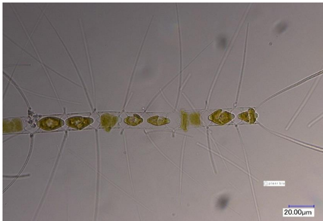
生細胞（光学顕微鏡）