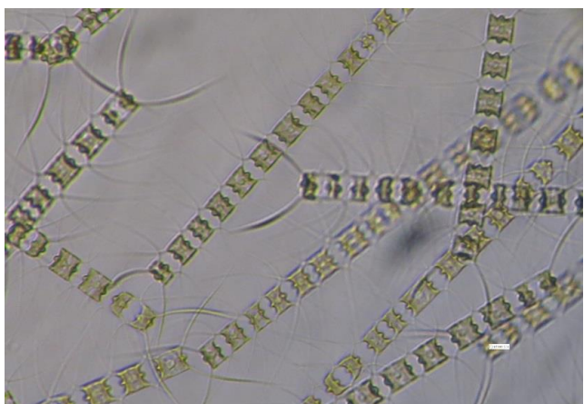
培養細胞（光顕：培養Well-plate）