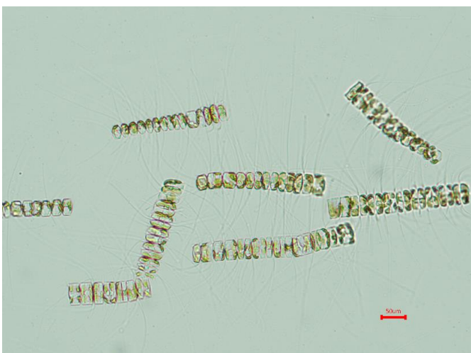
培養細胞（光顕：培養Well-plate）