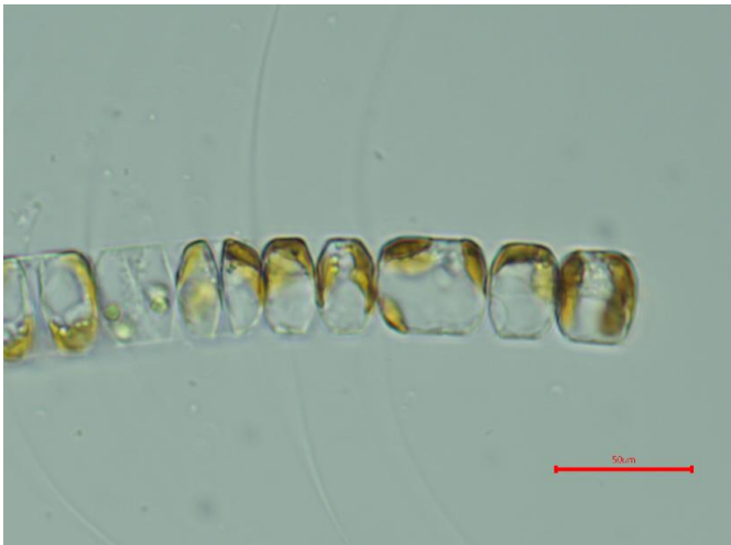
生細胞（光学顕微鏡）